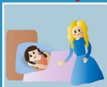
УХОД ЗА БОЛЬНЫМИ